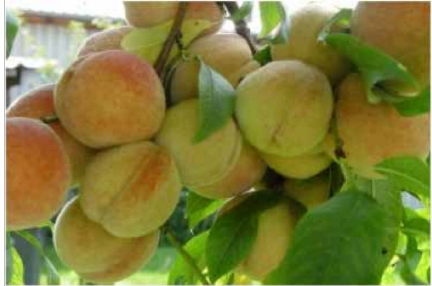
Greengold Pfirsiche, Gustl Rammel, Bad Aibling

Weltweit protestieren Verbraucher immer lauter gegen Ernährungsdefizite und Gesundheitsschäden, die herkömmlich behandeltes Obst, Gemüse und Getreide bei ihnen und ihren Kindern hervorrufen. Mit Greengold ist es möglich geworden, kostengünstig gehaltvolle und weniger belastete Lebensmittel zu erzeugen und gleichzeitig die Umwelt zu schonen.