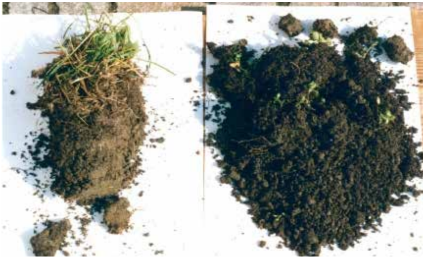
(konventionell behandelt) (nach 3 Jahren Behandlung mit Greengold)