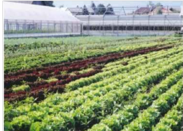
Bio-Anbau von Salat mit Greengold im Sommer 2003 ohne Bewässerung, Ökohof Feldinger, Wals