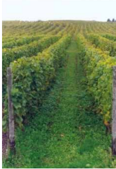
Bild Mitte u. rechts: im 3. Jahr der Greengoldbehandlung – ökologischer Anbau, mittlerweile schon im 9. Jahr ohne mineralische und organische Bodendüngung

Bild links: konventionelle Behandlung, Mineraldüngung, Verwendung von Fungiziden, Pestiziden und Herbiziden