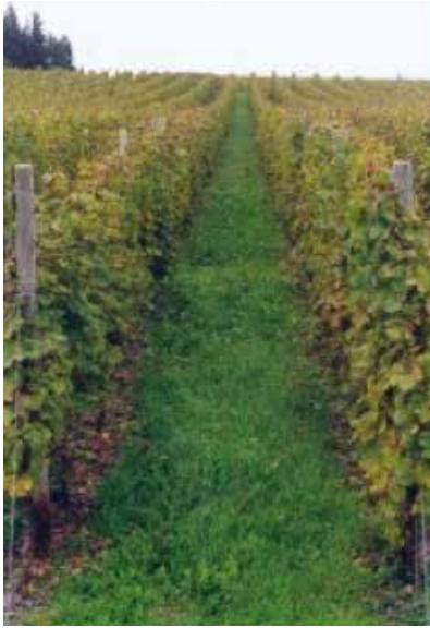
Bild links: konventionelle Behandlung, Mineraldüngung, Verwendung von Fungiziden, Pestiziden und Herbiziden