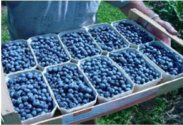
Heidelbeeren, Demeterhof Eitzinger, Chiemgau

Der Zuwachs an biologisch orientiertem Land- und Gartenbau und ein wachsendes Bewusstsein für Ernährung, Gesundheit und Umwelt verlangen immer mehr nach Produkten, mit denen man vor allem Nutzpflanzen wie Obst, Gemüse und Getreide aus dem Kreislauf chemikalischer Behandlung und Belastungen heraushalten und wieder herausführen kann.