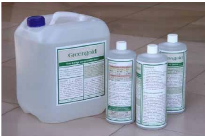
Greengold Funktionsmittel im 1-l- und 10-l-Gebinde

Die Einhaltung dieser Vorgaben garantiert die volle Wirkung von Greengold . Besondere Belastungen bzw. toxische Situationen können längerfristige Prozesse zur Folge haben. Dies kann weitere Anwendungen erforderlich machen, die dann auch in kürzeren Abständen erfolgen können. Eine Wirkung ist aber in jedem Falle gegeben und lohnt allen Aufwand und Mühe.