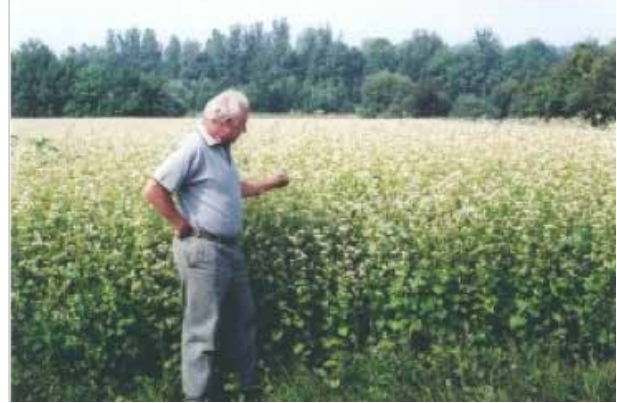
Biologischer Buchweizen mit Greengold Ökohof Feldinger, Wals bei Salzburg / Österreich

Unten: Tomatenanbau mit Greengold im Gewächshaus des Ökohofs Feldinger in Wals bei Salzburg. Die Ernteerträge konnten durch die Anwendung von Greengold im ersten Jahr bereits um 50 % gesteigert werden. Neben Greengold wurden noch Effektive Mikroorganismen und Steinmehl eingesetzt. Der Boden war mit Heu abgedeckt. Wurden in den vergangenen Jahren in diesem Gewächshaus 5 bis 7 Tonnen Tomaten geerntet, konnte in 5 Jahren die Ertragsmenge jeweils auf bis zu 12 Tonnen gesteigert werden. Auf dem Markt in Salzburg freuten sich die Kunden u.a. über wohlschmeckende und nahrhafte Tomaten.